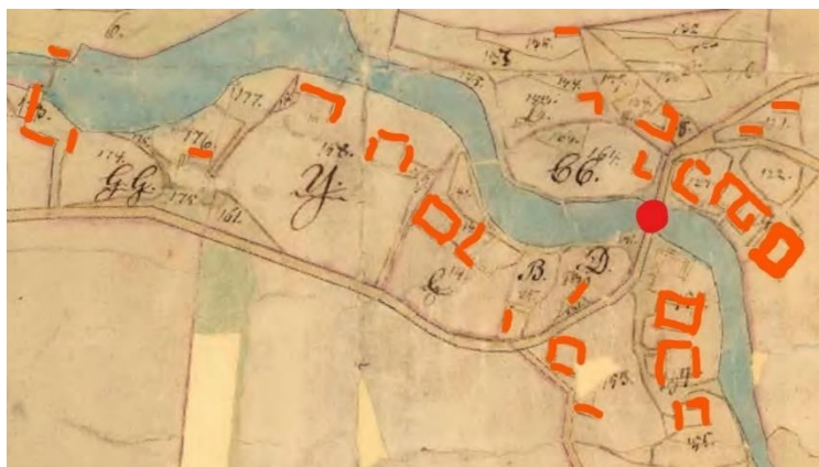
Bild 2. Ousby by vid tiden för Laga skifte 1849. Nästan alla gårdar på bilden är sedan dess flyttade eller rivna