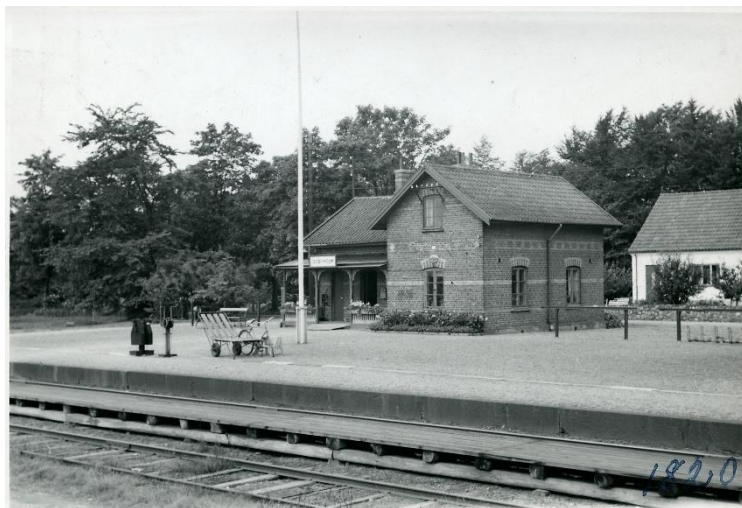
Bild 3. Osbyholms stationshus

År 1897 invigs järnvägen mellan Hörby och Eslöv efter mer än 50 år av diskussioner och utredningar.