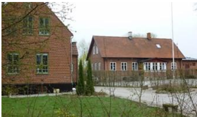
Bild 11. Ousbyholms skola