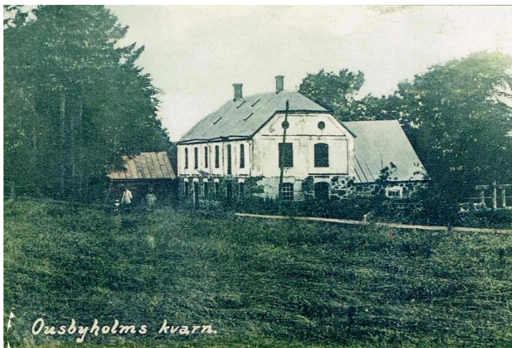
Bild 8. Kvarnen i Osbyholm

Kvarnplatsen uppges ha anor från 1100-talet.