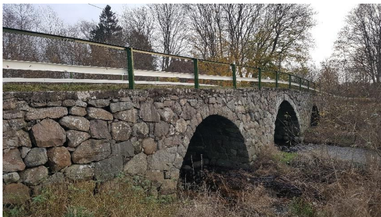
Bild 1. Den gamla stenvalvsbron över Hörbyån i Osbyholm