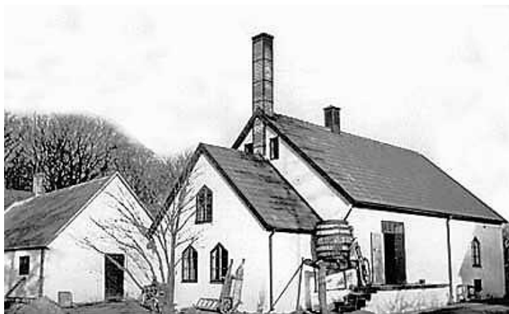
Bild 4. Mejeriet i Osbyholm